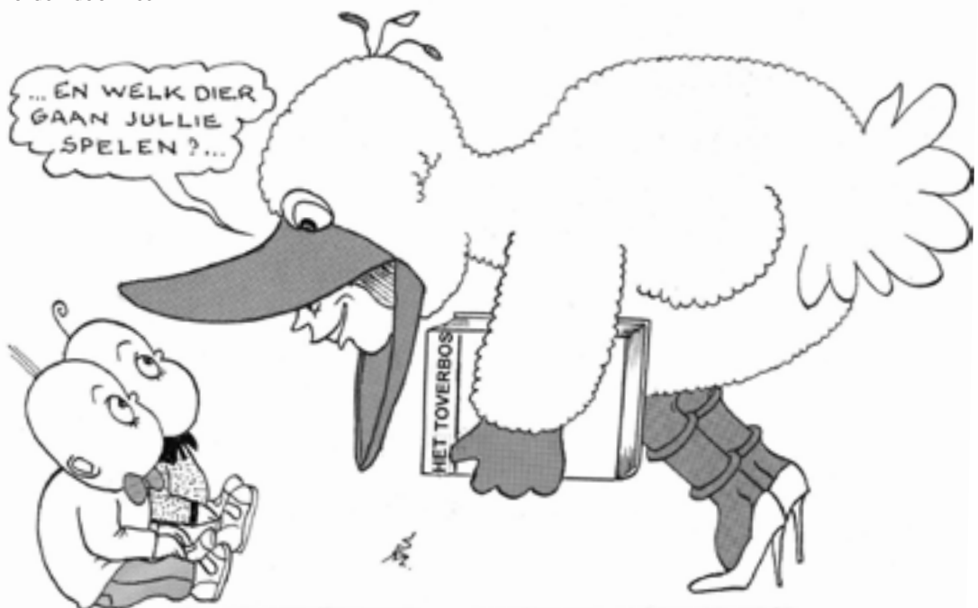
De coach is de veilige begeleidingsfiguur die actief meespeelt als Grote Vogel en de kleuters in hun ontwikkeling stimuleert ...

Tot slot wordt de fantasie door Het Toverbos sterk geprikkeld. Dit heeft zeker zijn voordelen omdat het leervermogen van kleuters dankzij hun fantasie vergroot wordt.