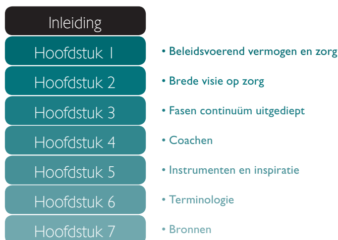
Figuur 1: Structuur van het zorgvademedecum

Een veilig pedagogisch klimaat houdt rekening met verschillen tussen leerlingen. Het gaat daarbij niet alleen om verschillen in culturele en subculturele achtergrond. Het heeft ook te maken met verschillen in fysieke en mentale ontwikkeling, met verschillen in motivatie, leerstijlen, leervermogen en talenten. Brede basiszorg betekent dat de leerkracht diversiteit als een meerwaarde ziet in een krachtig leerproces. De persoonlijkheid en de vaardigheden van de leerkracht vormen daarbij het uitgangspunt.